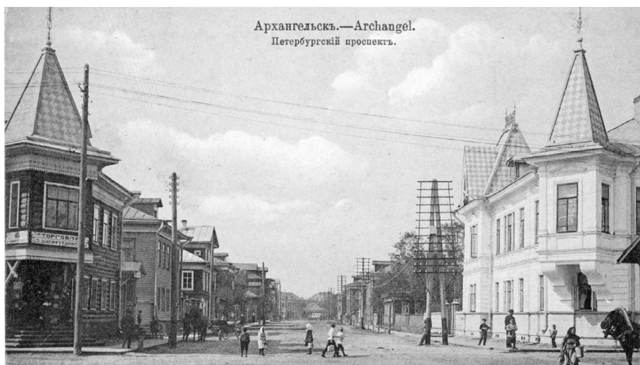
Петербургский проспект на видовой открытке начала XX века.

Для меня, исследователя деревянной архитектуры, представлял интерес для сохранения двухэтажный деревянный дом на углу улицы Володарского. Кто помнит? Он был построен в 1848 году. Его никто не проектировал. Форма и планировочное решение его результат долгой эволюции приспособления северного крестьянского дома под городскую образ жизни. Этот тип дома устраивал застройщиков и преобладал в застройке деревянного города. Из-за частого применения в застройке дореволюционного Архангельска его можно считать типовым домом.