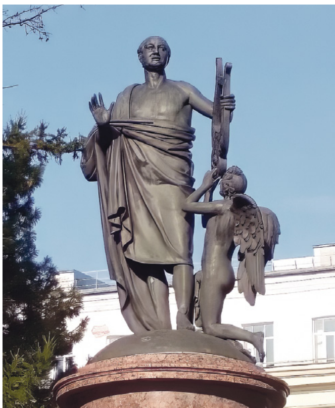
Памятник Ломоносову. Скульптор Иван Мартос. 1829.

Это строчки из оды «На день восшествия на престол императрицы Елизаветы», написанной Ломоносовым в 1747 году. Талантливый человек, он и талантлив во всём.