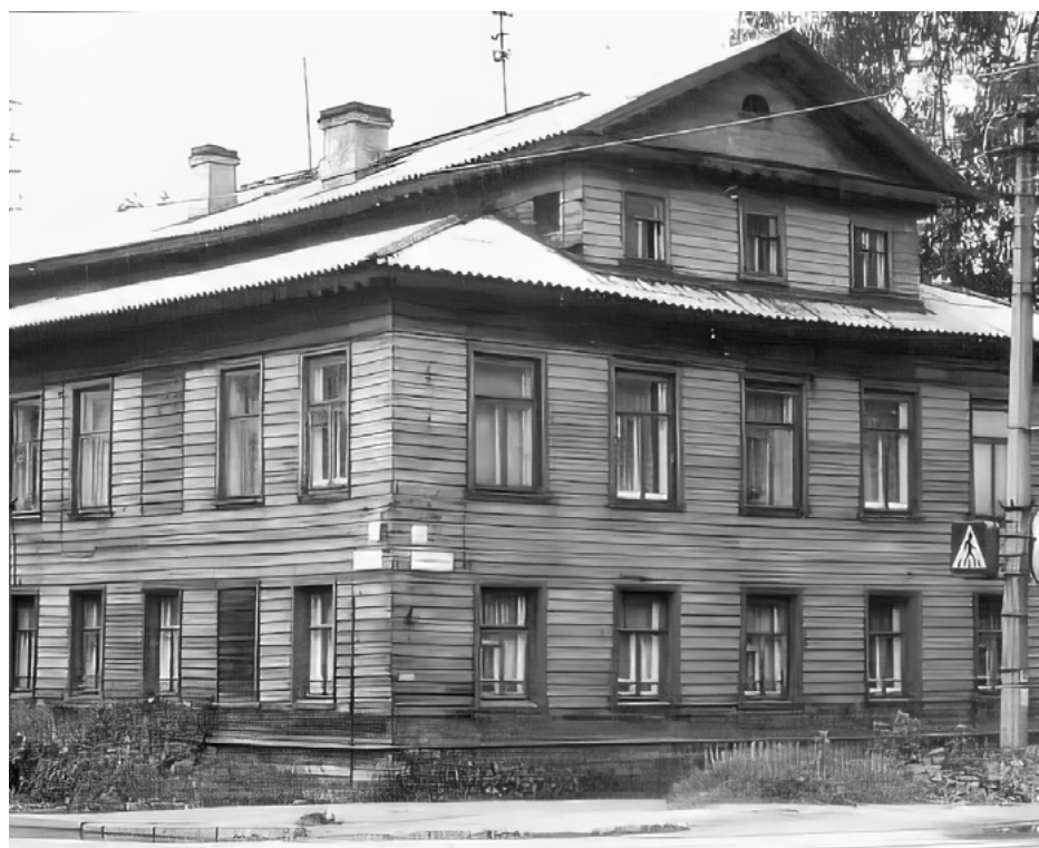
Дом, стоявший на углу улицы Володарского и проспекта Ломоносова.